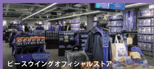
ピースウィングオフィシャルストア