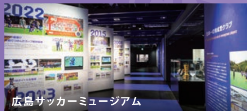
広島サッカーミュージアム

ユニフォームやタオルなどクラブ公式グッズはもちろん、ファンも観光客もうれしい広島県産品もラインナップ。